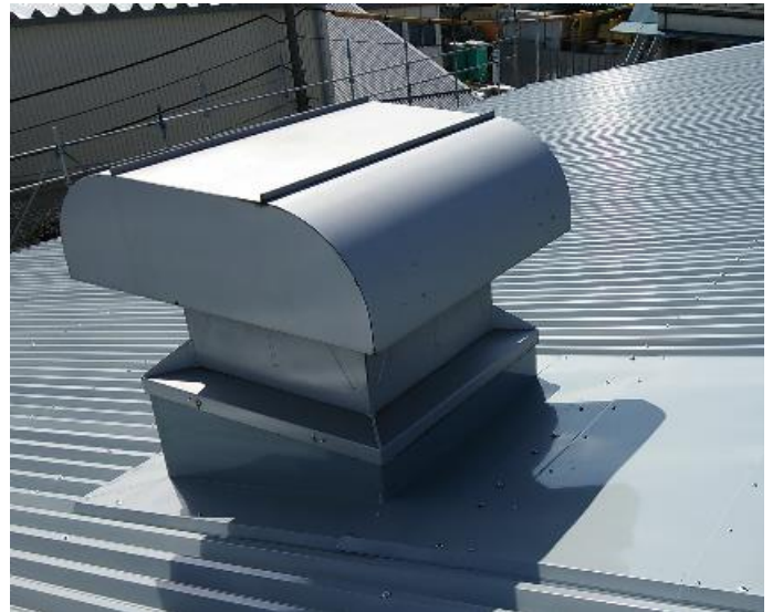
ベンチレーター塗装