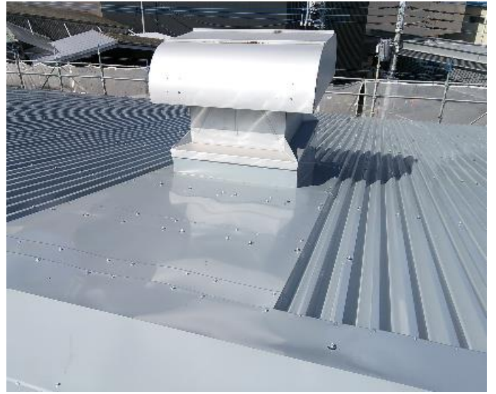
スレッシュユルーフ取付工事 完了