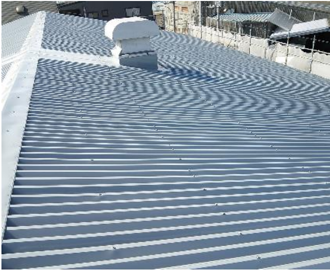
スレッシュユルーフ取付工事 完了