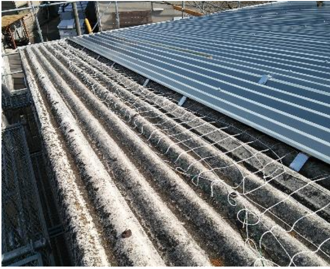
スレッシュルーフ取付