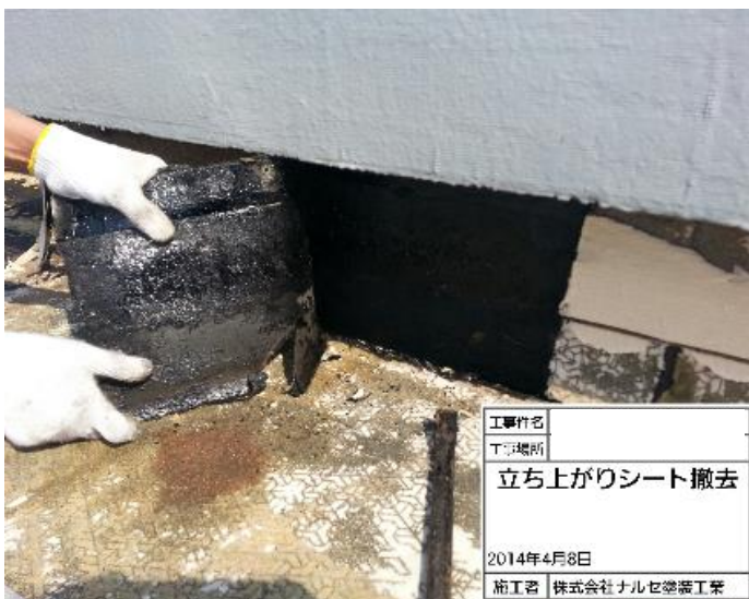
立上りシート撤去