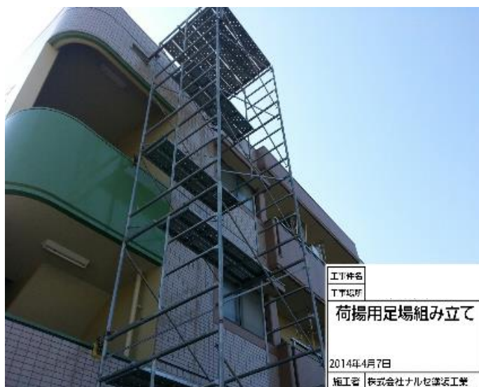
荷揚げ用足場組立