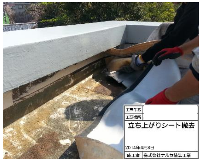
立上りシート撤去