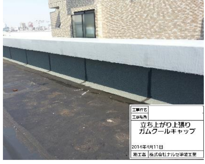
上張りゴムロールキャップ貼り付け