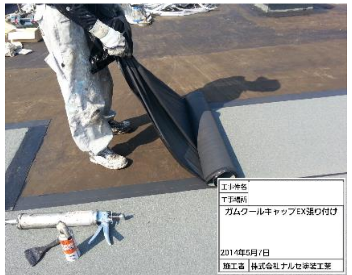
上張りゴムクールキャップEX貼り付け