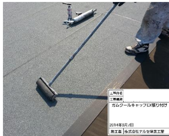
上張りゴムクールキャップEX貼り付け