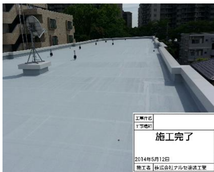
ドレン部ストレーナーキャップ設置