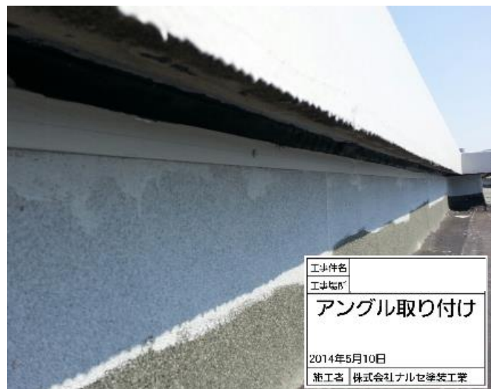
新規アングル取付