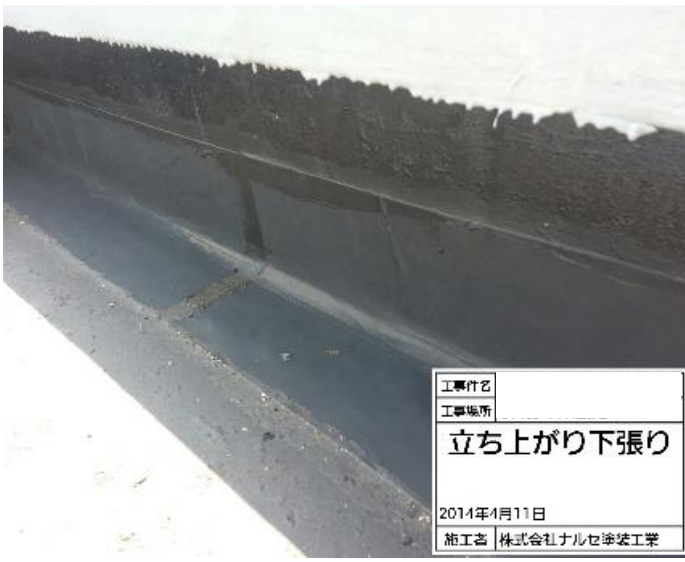
下張シート貼り付け