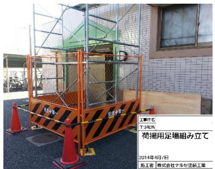
荷揚げ用足場組立