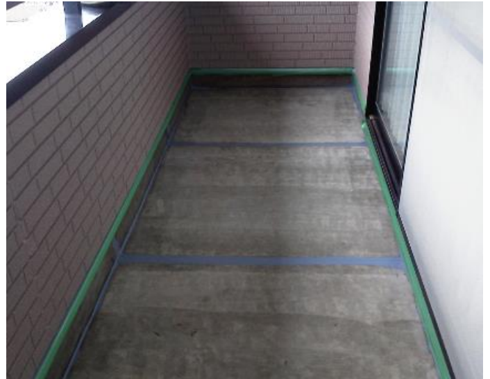
新規シーリング打込み