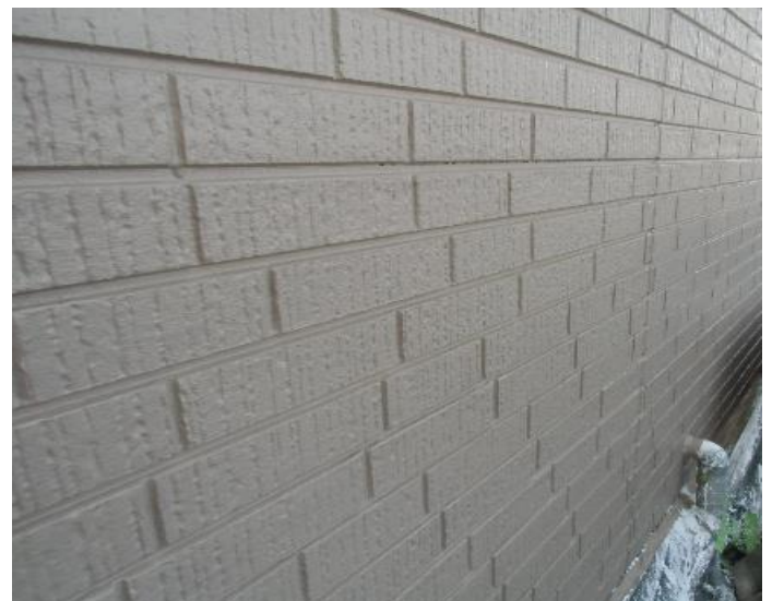
水性セラミシリコン 1回目完了