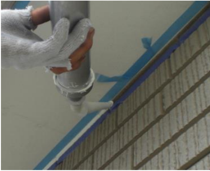
新規シーリング打込み