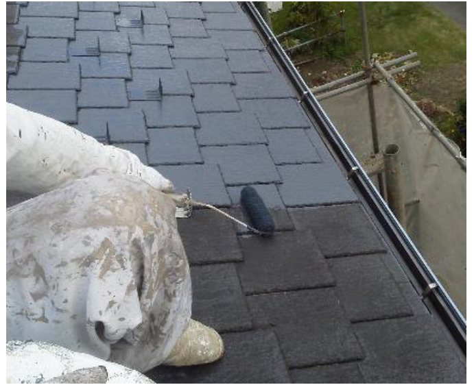
サーモアイUV 1回目塗装