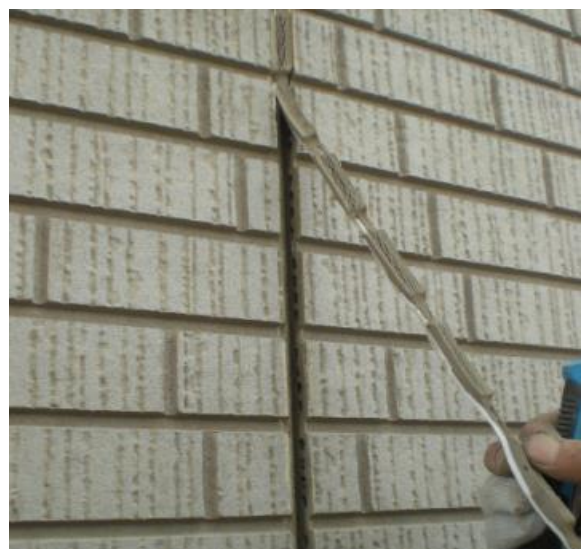
外壁 既存シーリング撤去