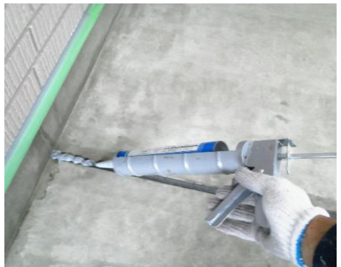
新規シーリング打込み