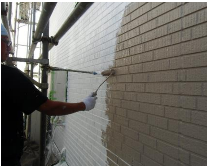
水性セラミシリコン 1回目塗装