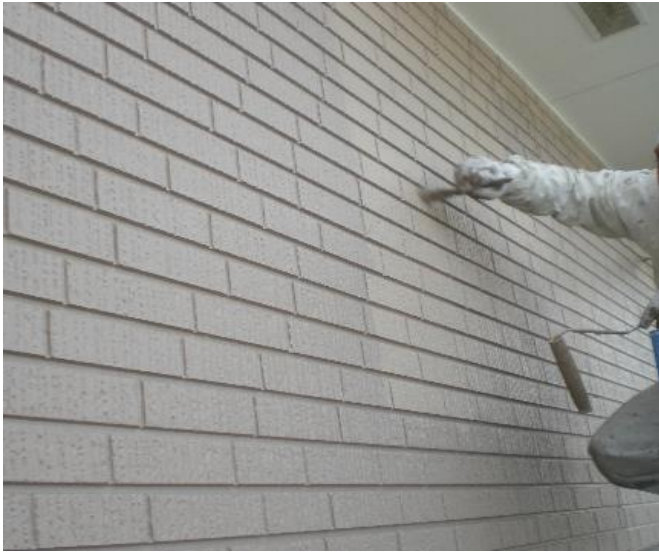
水性セラミシリコン 2回目塗装