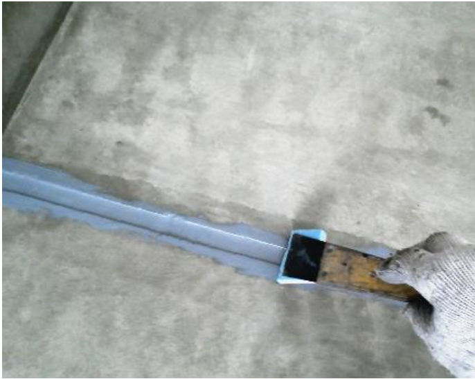
新規シーリング打込み