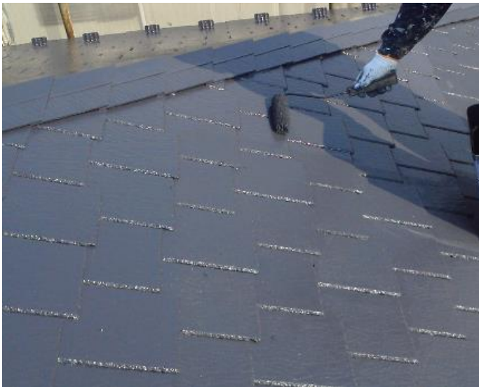
サーモアイUV 2回目塗装