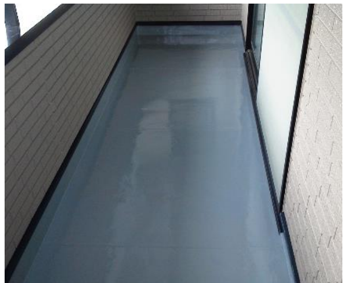
ベランダ防水 完了