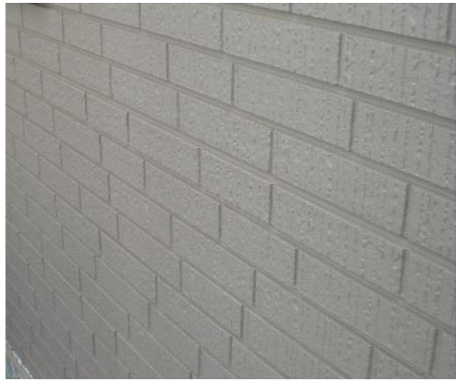
水性セラミシリコン 2回目完了