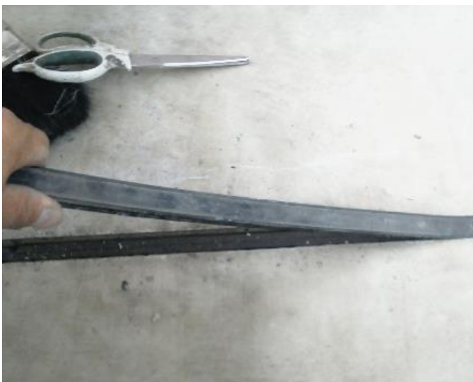
ベランダ 既存シーリング撤去