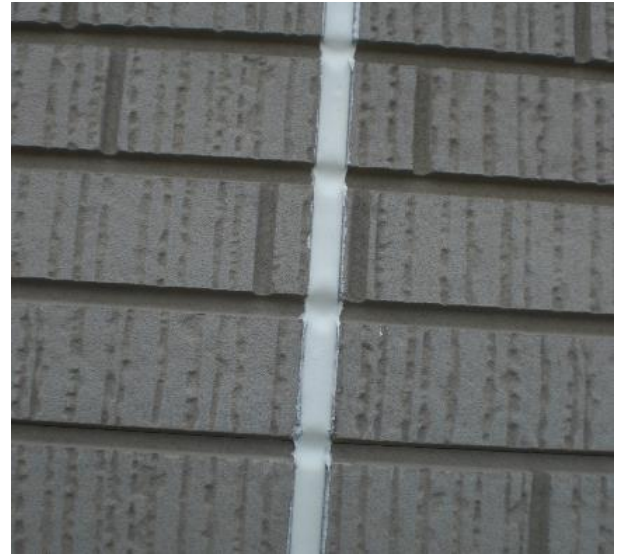
新規シーリング打込み完了